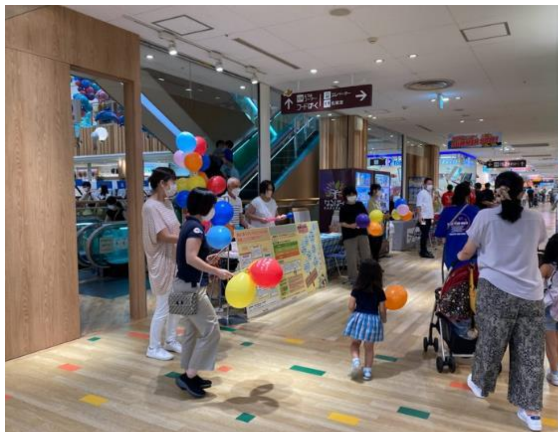
啓発活動及び説明・相談会