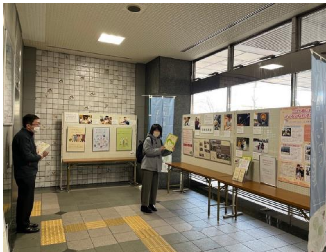
写真・パネル展示