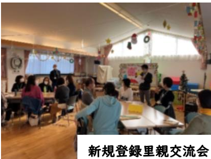
新規登録里親交流会