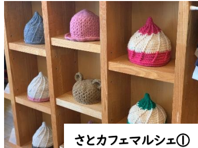
さとカフェマルシェ①