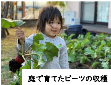
庭で育てたビーツの収穫