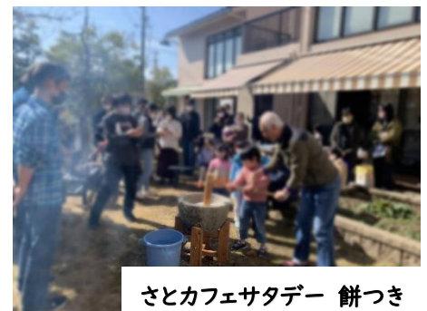
さとカフェサタデー 餅つき