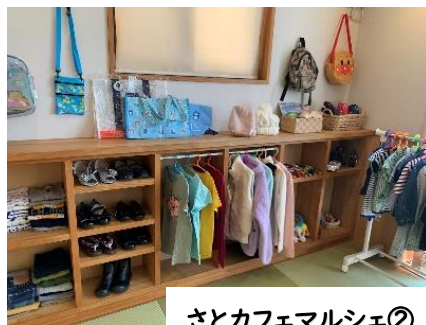
さとカフェマルシェ②