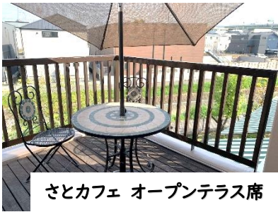
さとカフェ オープンテラス席