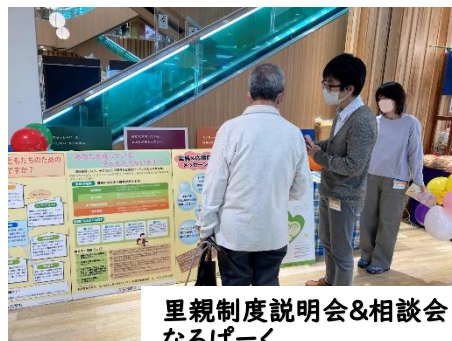
里親制度説明会&相談会 なるばーく